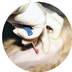
odběr kostní dřeně veterinárním lékařem