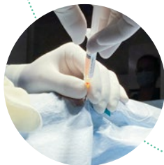
aplikace léčebného buněčného přípravku zvířeti ošetřujícím veterinárním lékařem