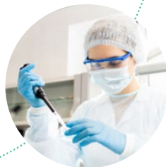
zpracování odebraného vzorku kostní dřeně