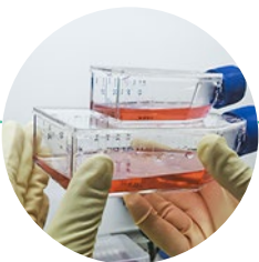
kultivace mezenchymálních kmenových buněk